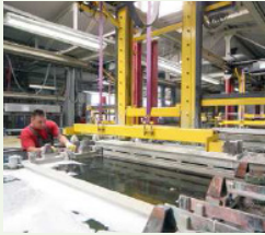
Pilot and market replication projects